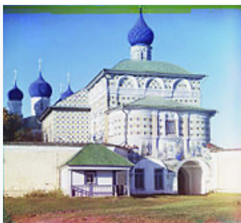
Надвратный храм на фотографии Прокудина-Горского (1910)